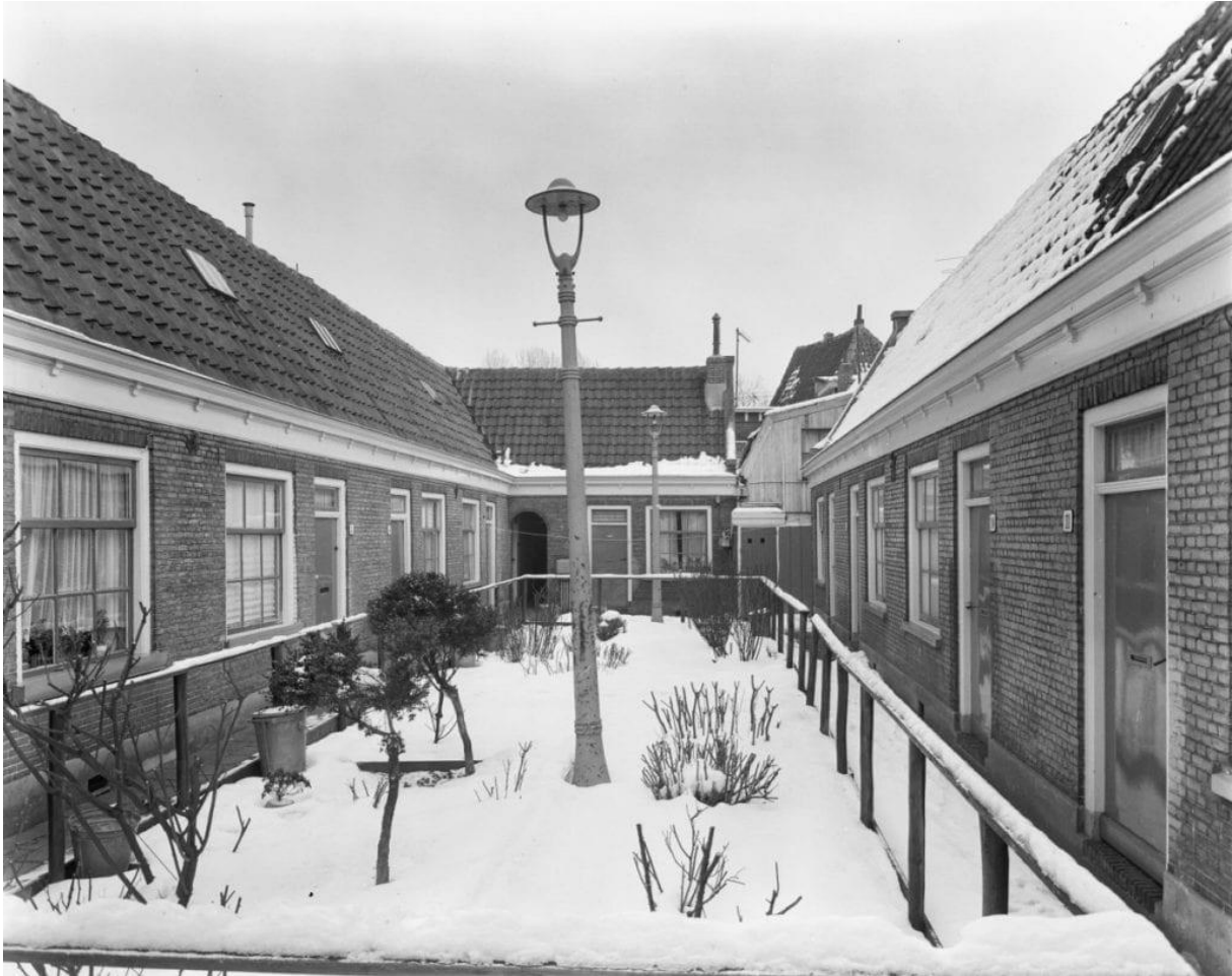
Het hofje in 1969.

In 1984 vindt er opnieuw een ingrijpende verbouwing plaats. Aan de achterzijde van de huisjes komen dakkapellen, zodat ieder huis op de bovenverdieping een eigen toilet en douche kan krijgen.